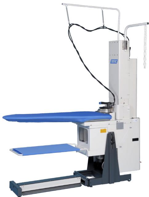
Table à repasser PLANOFLEX 2574