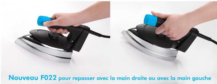
Nouveau F022 pour repasser avec la main droite ou avec la main gauche