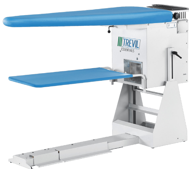
Table à repasser SUPERFLEX 2467