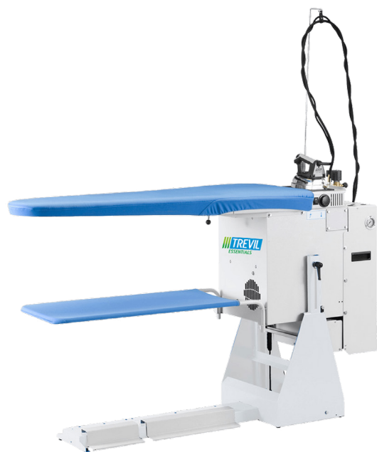
Table à repasser SUPERFLEX 2567