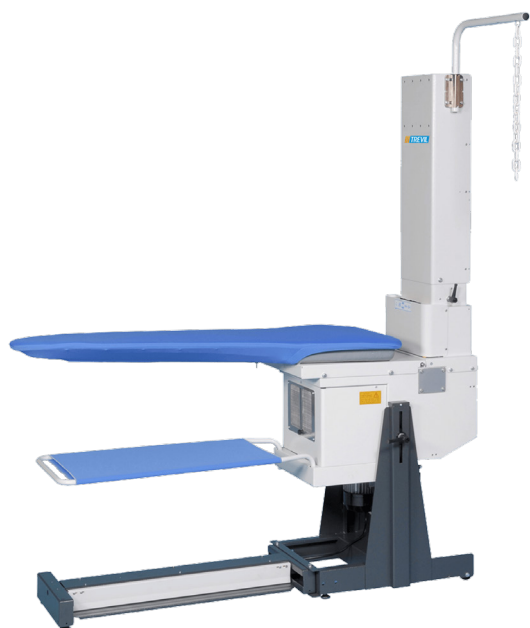
Table à repasser TREVIFLEX 2471