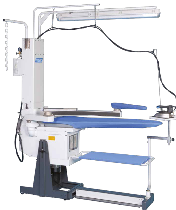
modèle présenté avec des options